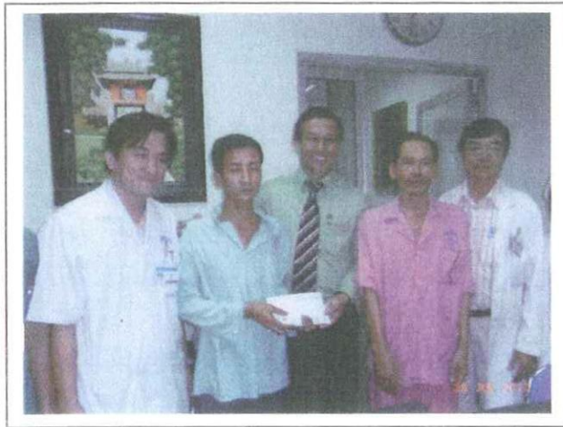
Tài trợ bệnh nhân nghèo mổ tim