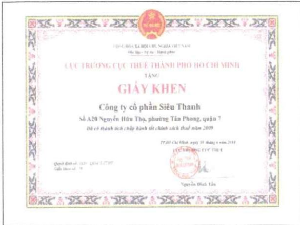
Giấy khen của Cục thuế TP.HCM