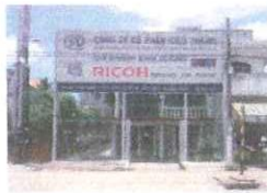
Binh Duong Branch