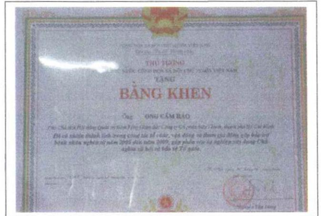
Bằng khen của thủ tướng chính phủ về hoạt động xã hội