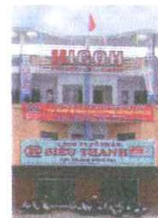
Dong Nai Branch