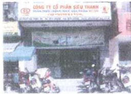
Da Nang Branch