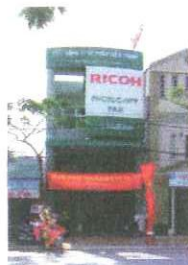
Can Tho Branch