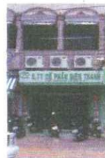
Vung Tau Branch