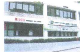
Ha Noi Branch