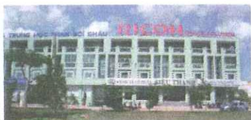
Head Office - Ho Chi Minh