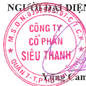
Yung Cam Meng